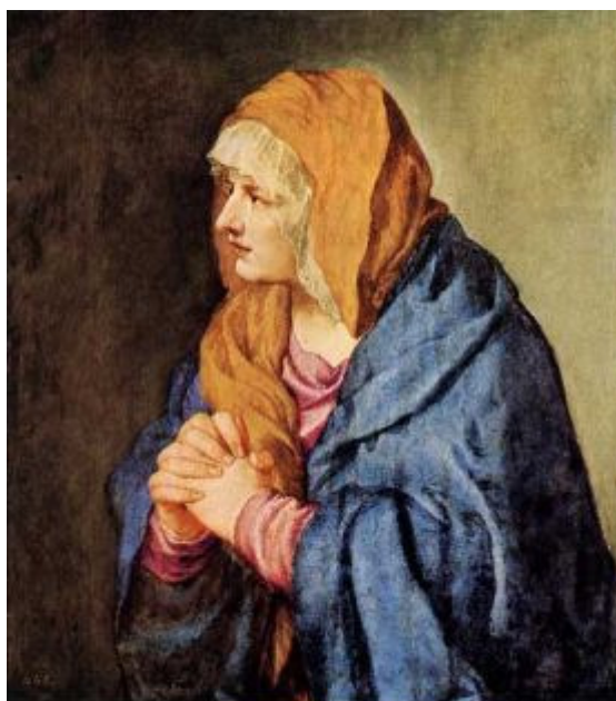
Ticiano: Mater Dolorosa

V. Te adoramos, oh Cristo, y te bendecimos. R. Pues por tu santa cruz redimiste al mundo.