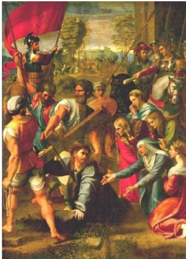
Rafael: Cristo cae camino del Calvario

V. Te adoramos, oh Cristo, y te bendecimos. R. Pues por tu santa cruz redimiste al mundo.