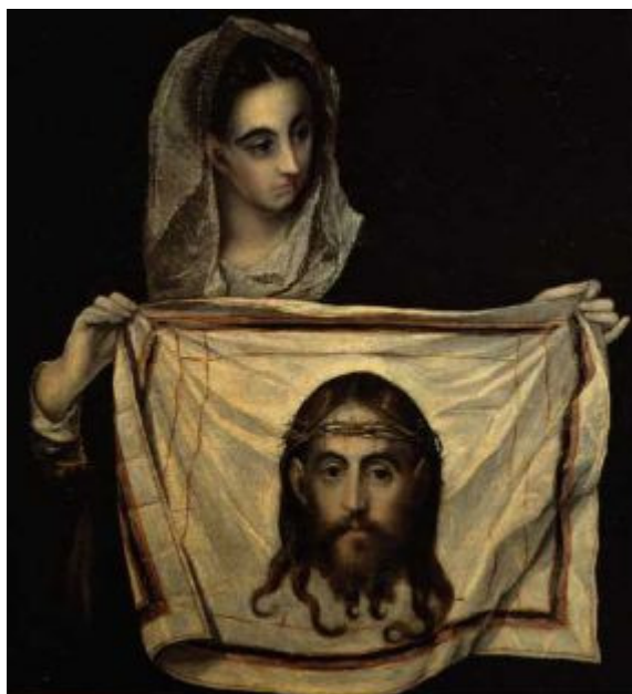
El Greco: La Verónica

V. Te adoramos, oh Cristo, y te bendecimos. R. Pues por tu santa cruz redimiste al mundo.