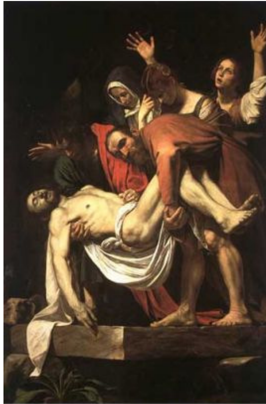
Caravaggio: Entierro de Cristo

V. Te adoramos, oh Cristo, y te bendecimos. R. Pues por tu santa cruz redimiste al mundo.