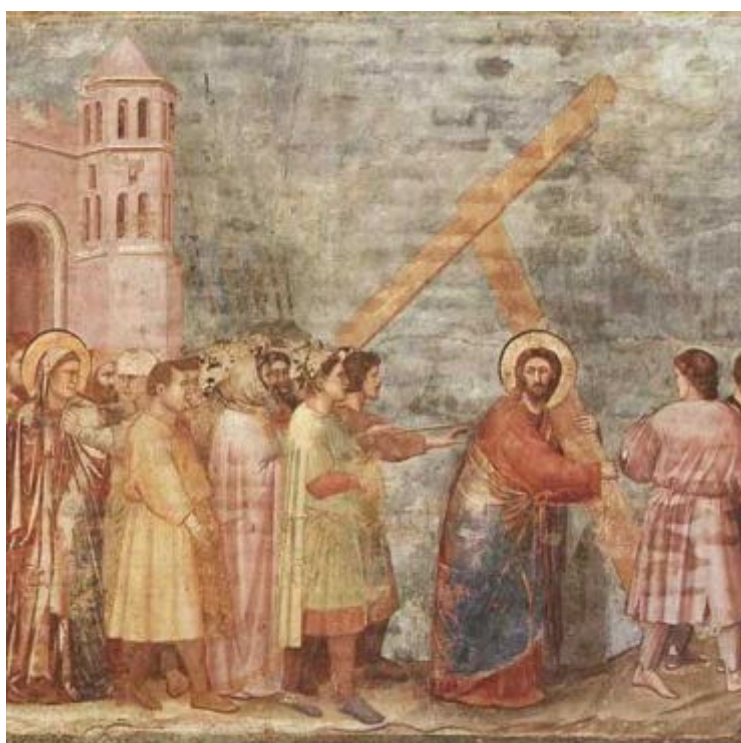
Giotto: Cristo camino del Calvario

V. Te adoramos, oh Cristo, y te bendecimos.