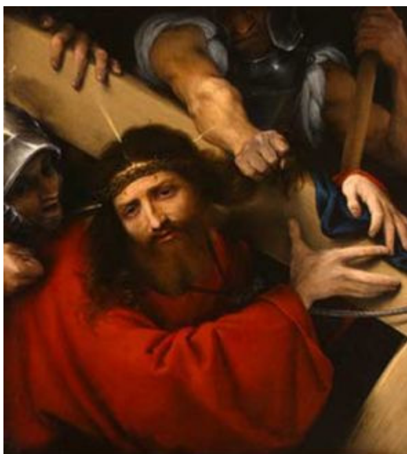
Lotto: Caída de Jesús

V. Te adoramos, oh Cristo, y te bendecimos. R. Pues por tu santa cruz redimiste al mundo.