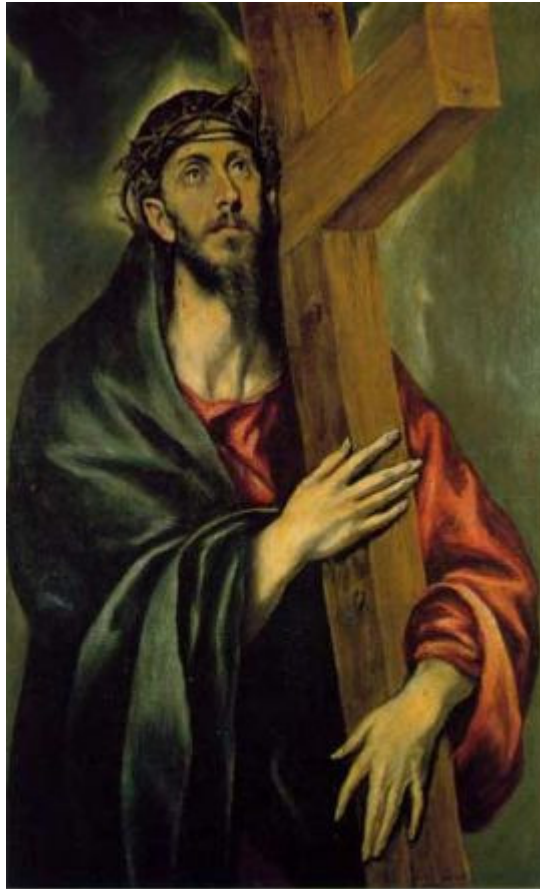
El Greco: Cristo cargado con la cruz

V. Te adoramos, oh Cristo, y te bendecimos. R. Pues por tu santa cruz redimiste al mundo.