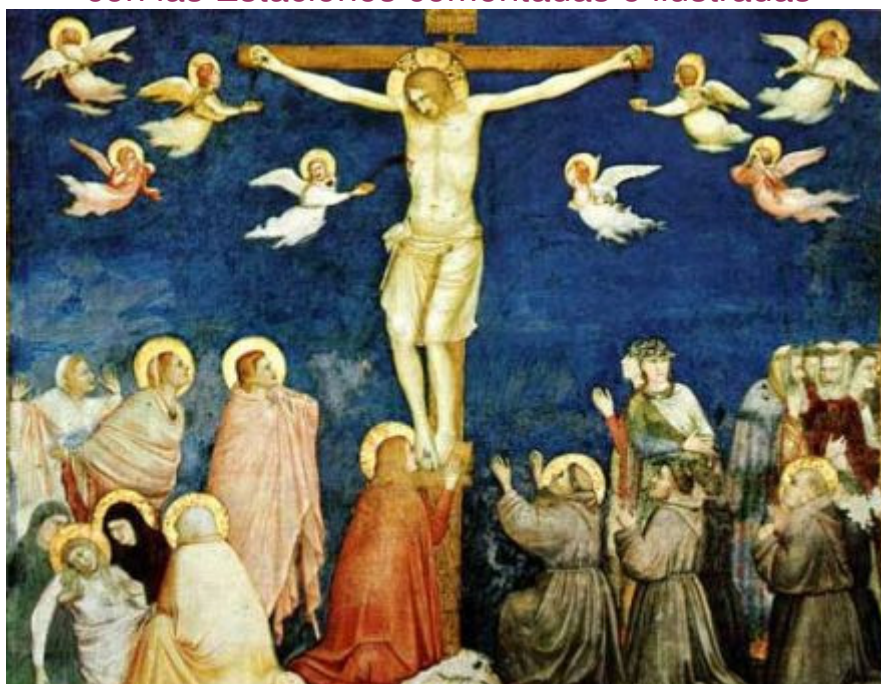
Giotto: La Crucifixión

El Vía crucis es una devoción centrada en los Misterios dolorosos de Cristo, que se meditan y contemplan caminando y deteniéndose en las estaciones que, del Pretorio al Calvario, representan los episodios más notables de la Pasión.