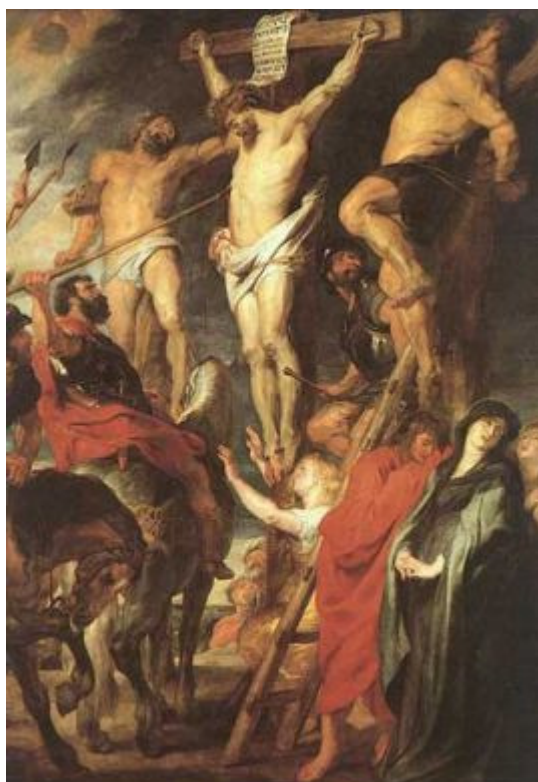
Rubens: La lanzada

V. Te adoramos, oh Cristo, y te bendecimos.