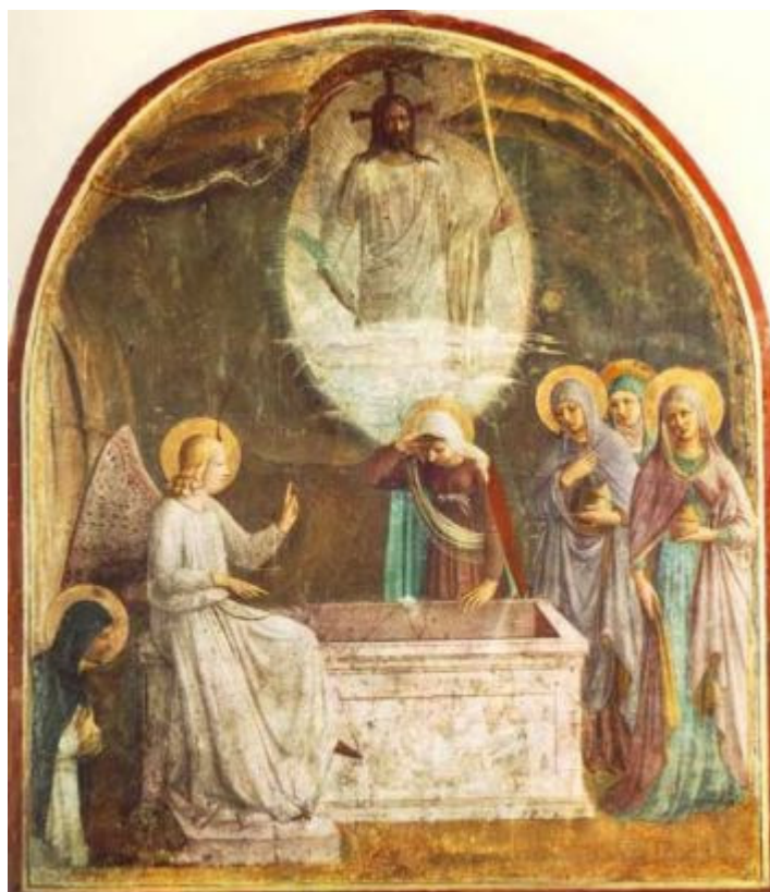
Fra Angélico: La Resurrección

V. Te adoramos, oh Cristo, y te bendecimos. R. Pues por tu santa cruz redimiste al mundo.