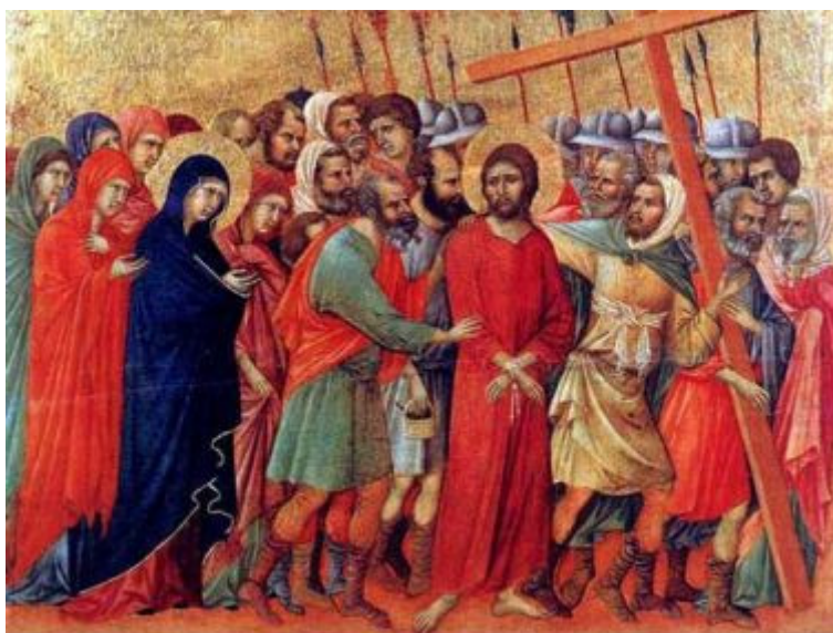
Duccio di Buoninsegna: Cristo camino del Calvario

V. Te adoramos, oh Cristo, y te bendecimos.