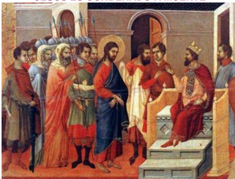
Duccio di Buoninsegna: Cristo ante Pilato

V. Te adoramos, oh Cristo, y te bendecimos. R. Pues por tu santa cruz redimiste al mundo.