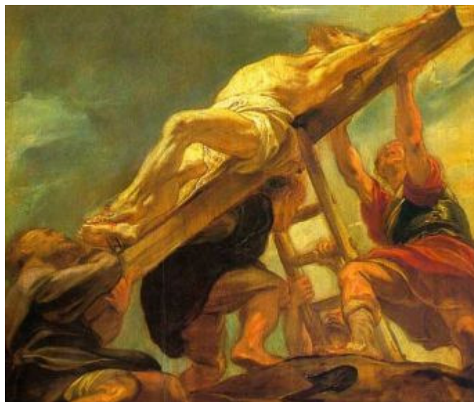
Rubens: Elevación de la cruz

V. Te adoramos, oh Cristo, y te bendecimos. R. Pues por tu santa cruz redimiste al mundo.