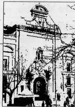
Parroquia San Nicolás El Real Guadalajara, 13 de noviembre de 2022