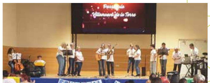
3 Parroquia de Villanueva de la Torre