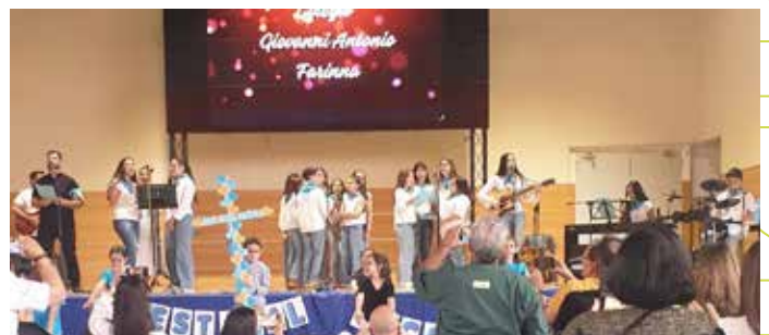
2 Colegio Giovanni Antonio Farina (Azuqueca)