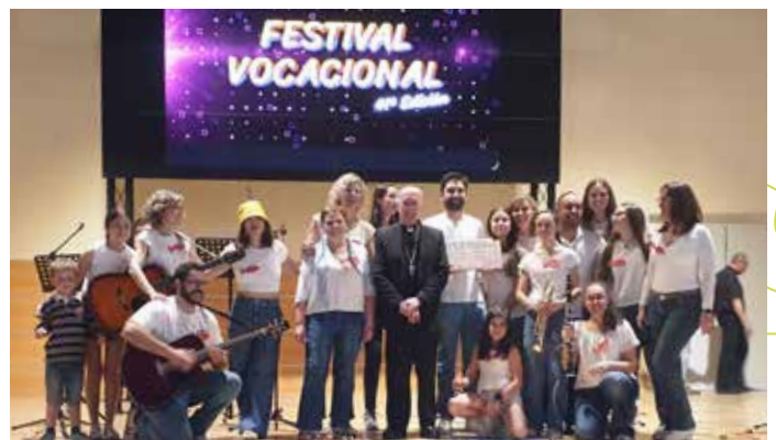
1 Santísimo Sacramento (Guadalajara)